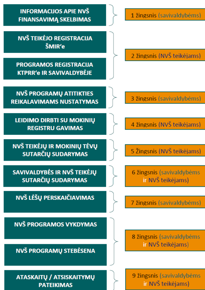
1 pav. Neformaliojo vaikų švietimo lėšų skyrimo ir panaudojimo schema