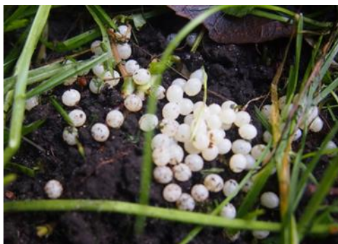
3 pav. Invazinių šliužų kiaušinių dėtis

Kiaušiniai balsvi, nepermatomi apie 4-5 mm skersmens, krūvelėmis po 60-200. (3 pav.)