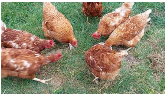
7 pav. Rudos dedeklės vištos puolė lesti dėžutėje pateiktus gyvus šliužus Viekšniuose, 2023 m., o baltos mėsinės vištos, uždarytos aptvare, to nedarė.