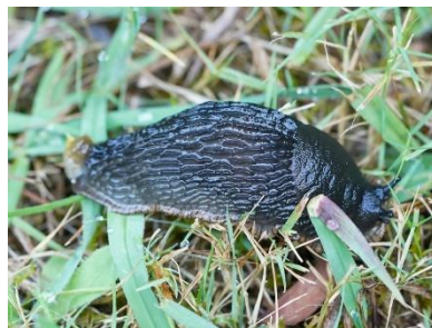
6 pav. Arion ater (Reiner Richter)