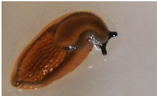
1 pav. Pavaizduotas Jaunas invazinis šliužas nuo 1 cm ilgio (Nuotr. M. Adomaičio).

Jaunikliai (nuo 0,5-1,5 cm ilgio) rusvi su dviem ryškiomis verpstės formos juostomis išilgai kūno šonų (1 pav.). Svarbiausias požymis – juodi akių čiupikliai kurie išlieka ir suaugusiems šliužams (2 pav. A ir B).