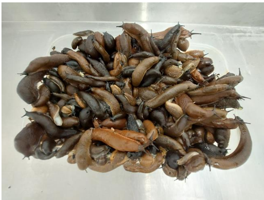
8 pav. Tiek šliužų gali būti surenkama per valandą.