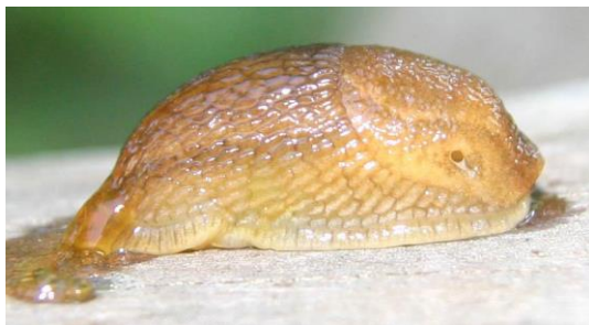
5 pav. Arion fuscus (O.F. Müller, 1774)

Invazinius šliužus dažnai galima supainioti su vietinėmis Arion fuscus (pav. 5) ir Arion ater (6 pav.) rūšimis. Arion ater yra saugomas ir yra įrašytas į Lietuvos raudonąją knygą.